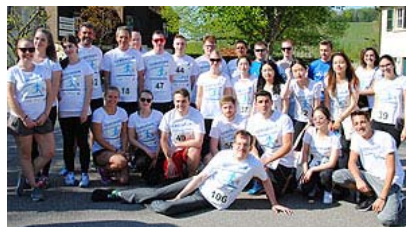
Das gesamte BU-Team

Abgerundet wurde das Sportevent wie schon in den Vorjahren mit einem gemeinsamen Grillfest bei Löwenstein .