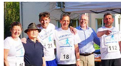
Das BU-Professoren-Laufteam im Einsatz

Lesen Sie auch den ausführlichen Bericht der Heilbronner Stimme .